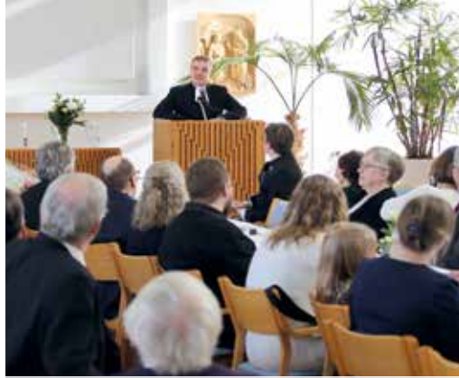
Messun jälkeen vietettiin virkaanasettamisjuhlaa seurakuntatalossa