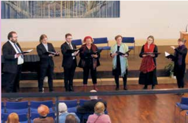
Seurakuntalaisilla kanttorit esittivät musiikkia Olavinlinnan 550-vuotisjuhlan hengessä.