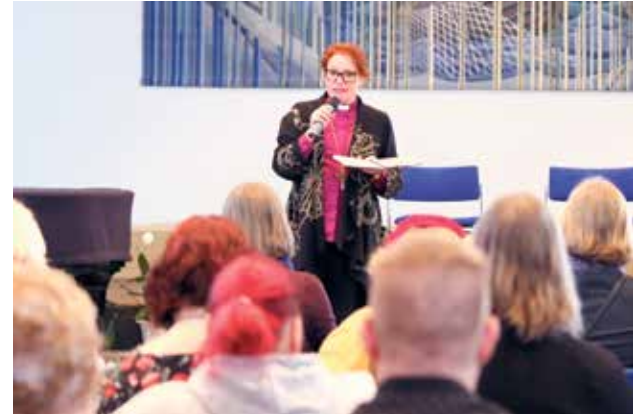
Piispa kannusti luottamushenkilöitä ja työntekijöitä pitämään rohkeasti esillä kaikkea sitä hyvää, mitä kirkko tekee.