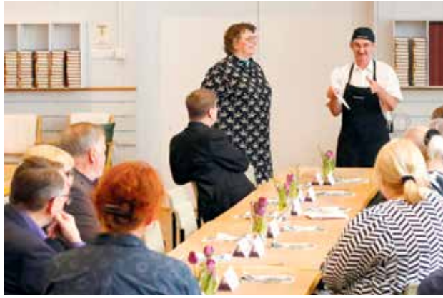
Kapustaukkojen laittaman lounaan aikana piispa tutustui Savonlinnan kaupungin ja Enonkosken kunnan edustajiin.